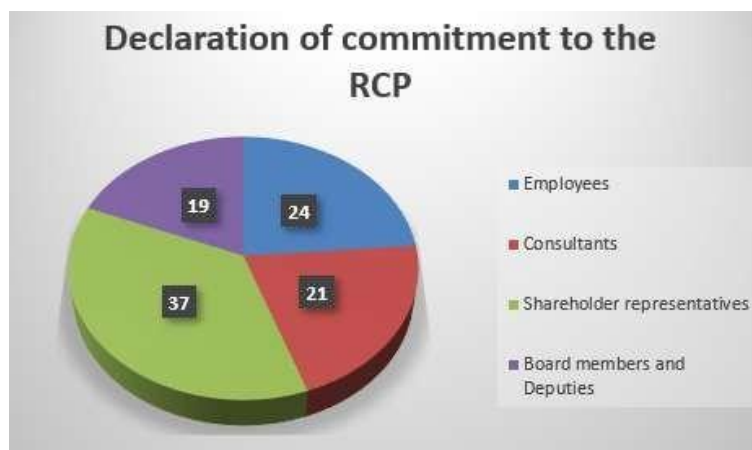
Figura 2 – Pamje e Deklaratave të nënshkruara të angazhimit për PPRr-në në vitin 2022

Për më tepër, katër individë nënshkruan Deklaratën e Pavarësisë të zbatueshme për anëtarët e Bordit dhe Zëvendësit e emëruar nga aksionarët e OPST-së së TAP-it.